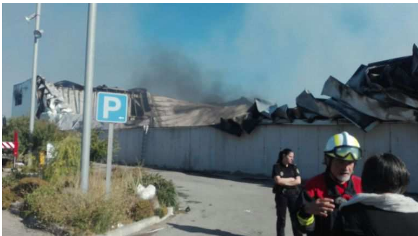
La planta TIV seguía ardiendo en algunas partes durante la mañana de este miércoles.

El tema entrará por la vía de urgencia en una reunión ya programada