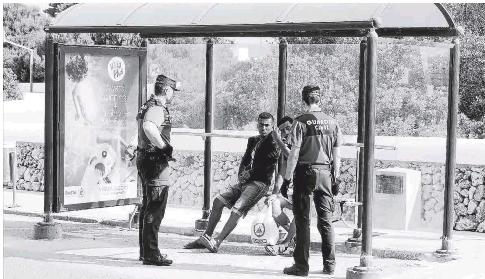
Dos de los detenidos argelinos por la Guardia Civil, ayer por la mañana en una parada de Binibèquer.

Los dos primeros detenidos, menores de edad, se dirigieron al Hotel Sur Menorca a las 4.45 horas. Allí pidieron ser trasladados a un centro de menores, alimentos, asearse y un lugar para dormir informando que acababan de llegar en patera como anunciaba la humedad de sus ropas. El hotel avisó a la Guardia Civil que en poco tiempo, tras hacerse cargo de ambos, movi-