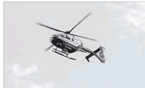
El helicóptero de la Policía Nacional en tareas de búsqueda.

presentaron en el Ayuntamiento solicitando un lugar para dormir. Los empleados municipales avisaron a la Policía Local que se hizo cargo de ellos y los condujo a la Policía Nacional. Uno estaba documentado, con móvil, y pedía contactar con su mujer que residía, dijo, en Alemania. Todos los arrestados han quedado bajo custodia de la Policía tras