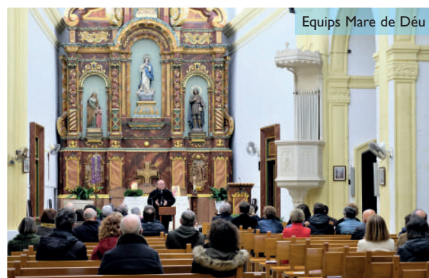
Equips Mare de Déu