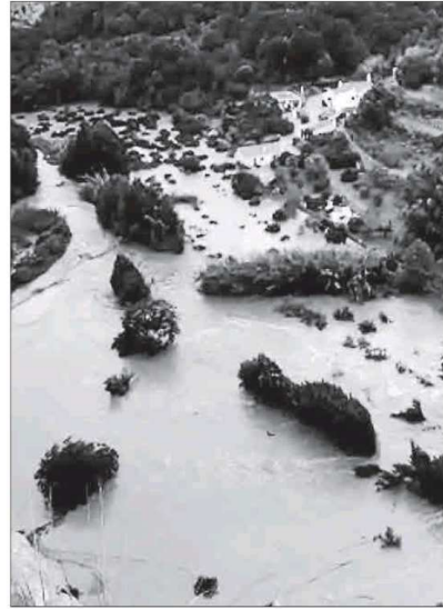
Dos imágenes del torrente del Barranc d'Algendar en una zona Interior, a la derecha, y a su llegada a la urbanización de Cala Galdana.