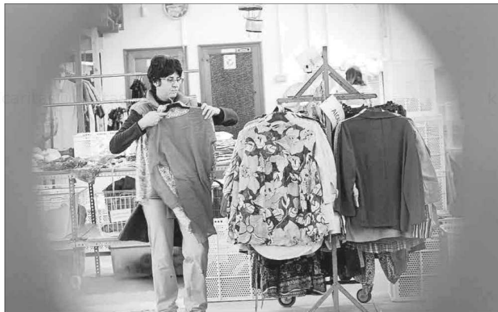
Una voluntaria coloca ropa en uno de los establecimientos solidarios de Caritas.

El gran consumo de textil ha convertido las prendas desechadas en un problema medioambiental, de ahí la importancia de su recogida y de proyectos como el de Moda-re de Caritas. Desde la entidad, que ha hecho público su Informe de Economía Solidaria 2021, recuerdan que toda la ropa es bienvenida, aunque esté deteriorada, ya que si no sirve para el mercado de segunda mano en las tiendas, se envía fuera para su reciclaje en las plantas de tratamiento de residuo textil de la confederación de Caritas tiene en Bilbao, Barcelona y Valencia. Allí la ropa vieja se selecciona y