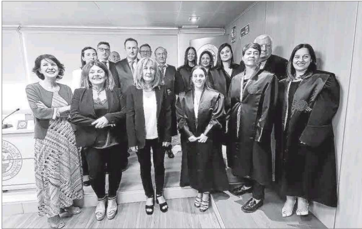
Abogados con 25 años de oficio y los nuevos, a los que ayer se les impusieron las togas.