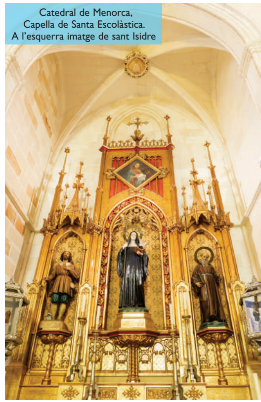
Catedral de Menorca, Capella de Santa Escolàstica. A l'esquerra imatge de sant Isidre