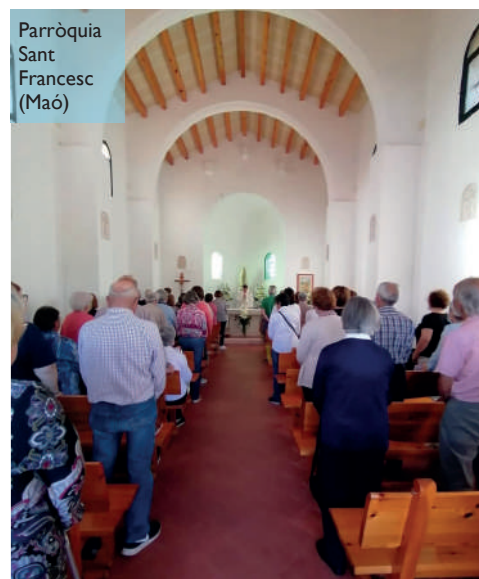
Parròquia Sant Francesc (Maó)