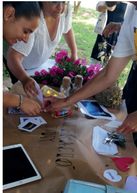
Una celebració de final de curs del Departament de Pastoral, amb professorat.

N'és un exemple el cas del Departament de Pastoral, on hi participen representants de famílies, alumnat, professorat i de la parròquia. El discerniment, el debat, el diàleg, l'escolta, el tenir clar que l'objectiu és caminar junts per organitzar tasques que impac-