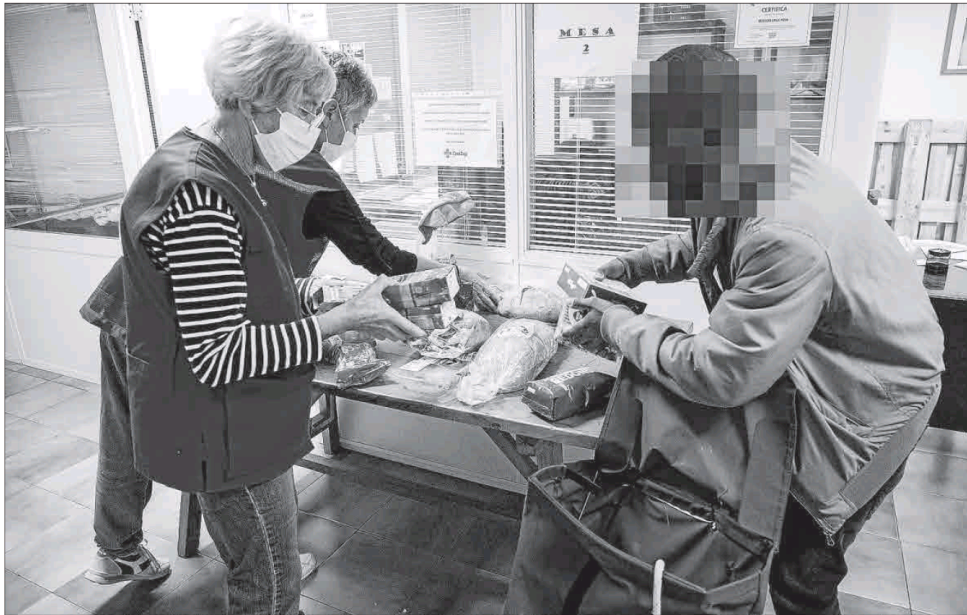
Los voluntarios de Cruz Roja entregaron ayer lotes de comida a los más necesitados en la sede de Maó.