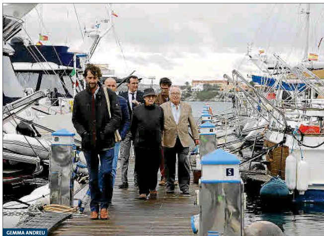
La comitiva formada por representantes de Autoridad Portuaria y Trapsayates recorre los pantalanes.