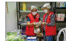
Banco de alimentos en Maó.