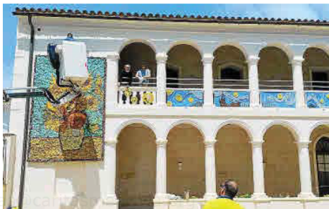
Cinco días más tarde la brigada municipal retiró el mural efímero realizado por los voluntarios de la asociación de vecinos de Tanques del Carme.