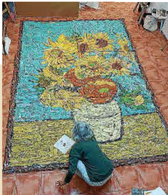
Empleada para el mural es el collage con gurrufos de papel de revista para representar la textura de la pincelada de Van Gogh