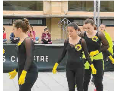
Las patinadoras artísticas de la Unión Deportiva realizaron una preciosa coreografía con la canción «Girasoles» de Rozalén en el Claustre del Carme.

Luego el clima adverso con amenazas de lluvia y tramontana no permitió celebrar el acto festivo previsto. Cuatro días después de colgarlo la brigada municipal vino a retirarlo. Van Gogh es eterno, pero nuestra obra no.