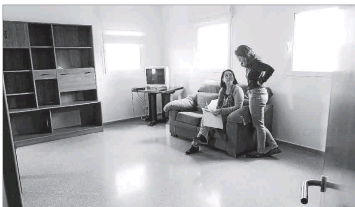
Trabajadoras de Caritas en el salón del piso existente en el edificio Calabria de Maó.

Hay promociones previstas para aumentar dicha cifra en 104 viviendas de alquiler, según la web oficial del Ibavi, que por otro lado informa de que hay 441 familias o unidades de convivencia en lista de espera.