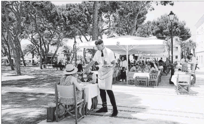
Un camarero atiende la terraza de un establecimiento de la Plaça des Pins, en Ciutadella.

El desempleo interanual bajó en todos los sectores. Así, los servicios concentran 1.659 parados, 19 menos que hace un año; 233