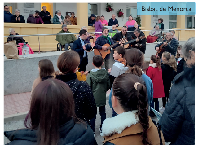
Bisbat de Menorca

El 22 de desembre els fillets de catequesi de la parròquia de Santa Eulàlia d'Alaior van cantar Nades al geriàtric del poble. Una tradició que el 23 de desembre van fer els escoltes i els fillets de catequesi de la parròquia de Sant Bartomeu al geriàtric de Ferreries. El Cant de la Sibilla ha estat una altra de les tradicions que s'ha viscut, un any més, a Alaior, Maó i Ciutadella.