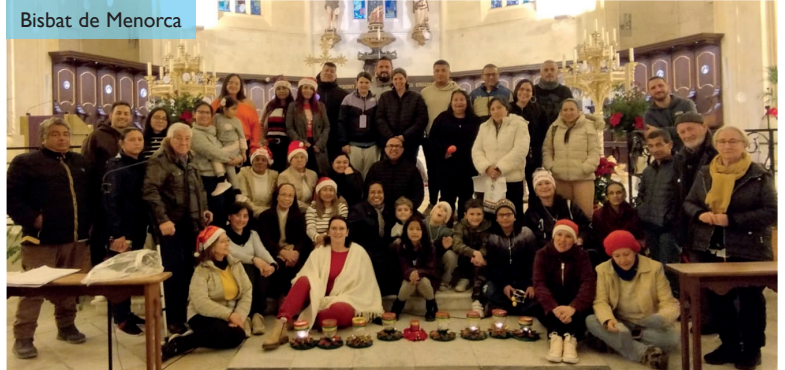
Bisbat de Menorca

Que este tiempo de recogimiento sea de gran provecho espiritual y que las familias puedan hallar la unión y el amor que nos trasmite el ejemplo de la Sagrada Familia, donde la protección del cielo siempre permanece y el amor supera cualquier adversidad.