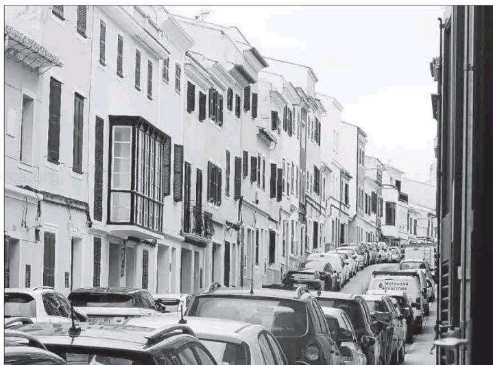
Maó es el municipio con más hogares en situación de hacinamiento, según el INE.