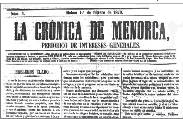
Portada del primer número de La Crònica de Menorca