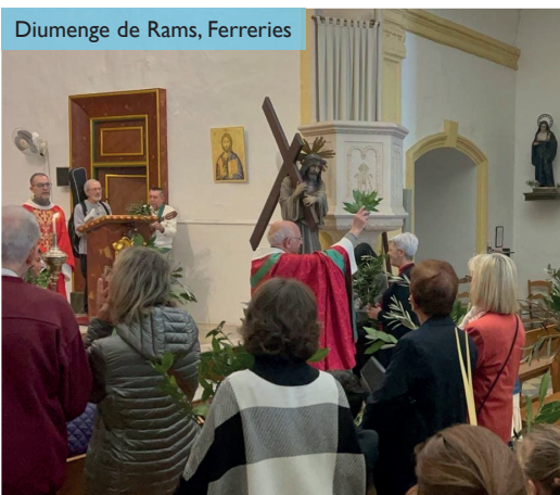
Diumenge de Rams, Ferreries