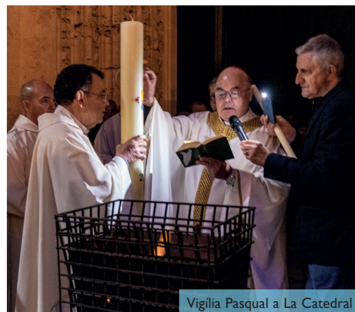
Vigília Pasqual a La Catedral