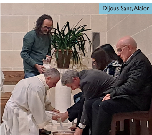
Dijous Sant, Alaior