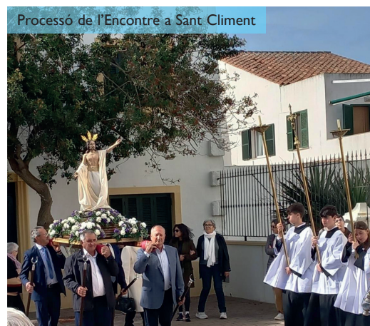
Processó de l’Encontre a Sant Climent

Trobareu més informació i fotografies de la Setmana Santa a la pàgina web del Bisbat de Menorca (bisbatdemenorca.org).