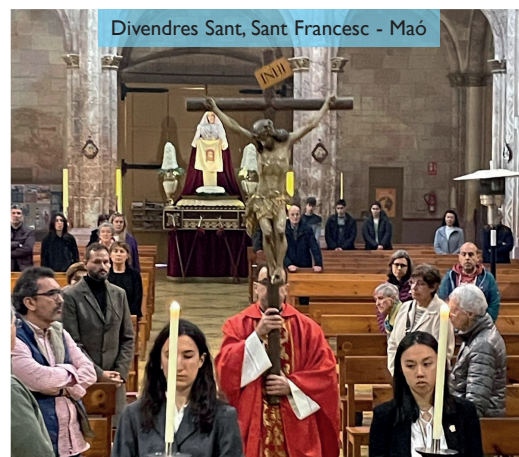
Divendres Sant, Sant Francesc - Maó